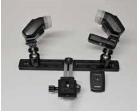
Twin flash inalámbrico "casero".

Si queremos una iluminación más versátil y también más laboriosa de conseguir, utilizaremos el twin flash , dos flashes montados en un soporte que podemos desplazar a nuestra voluntad.