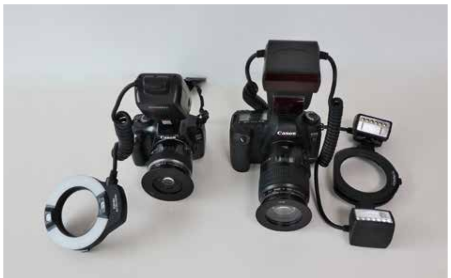
A la izquierda cámara réflex básica con sensor de tamaño APS-C, objetivo macro de 60mm y flash anular. A la derecha cámara réflex full frame con objetivo de 100mm macro y twin flash.

Si queremos ir profundizando, nos decantaríamos por la colección de vídeos de Dental Photo Net. En total son 5 vídeos realizados por un fotógrafo profesional especializado en ortodoncia. Son lo más claro y didáctico que he encontrado. Son amenos y sencillos, merece la pena que los veáis todos, no os arrepentiréis.