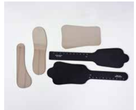
Espejos y fondos negros de diferentes tamaños

Para que la foto no nos salga trepidada (movida) tendremos que usar una velocidad de obturación superior a 1/100 de segundo. Si usamos flashes, utilizaremos la velocidad de sincronización más alta que nos permita la cámara; suele ser de alrededor de 1/200 de segundo.