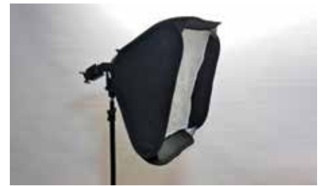
Flash speed light con una ventana (softbox) de 60x60cm. Muy útil para fotografías de cara completa.

Sobre todo, en la fotografía intraoral es vital una buena iluminación. La iluminación con LEDS es mucho menos potente que la de flash, y en mi opinión está indicada solamente en el caso de que vayamos a grabar video.