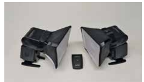
Dos flashes de mano (flash cobra o speed light) con dos pequeños difusores y disparador inalámbrico.

Los LEDS más habituales son de este tipo: