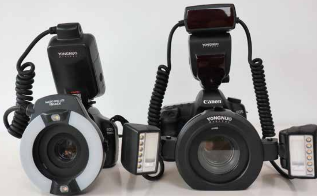
A la izquierda flash anular montado. A la derecha twin flash montado.

La fotografía es una potente herramienta que podemos utilizar de muchas maneras en nuestro ámbito laboral.